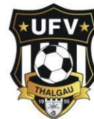
Tabelle Kampfmannschaft 1b